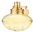
S by Shakira