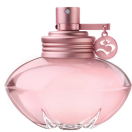
S by Shakira Eau florale